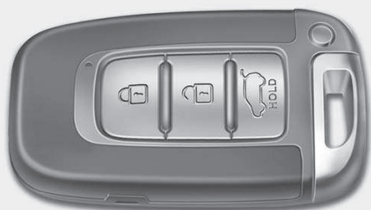
■ Tipo A