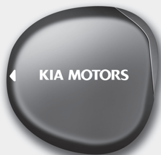
■ Tipo B