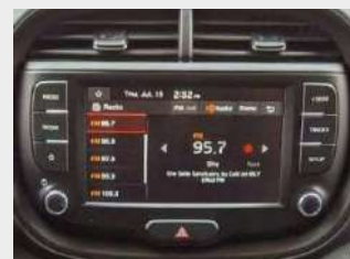
Radio DAB con schermo touchscreen da 8" con Apple CarPlay/Android Auto