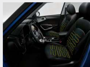
Sedili anteriori ventilati