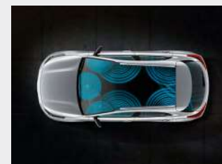
Sistema audio premium Harman Kardon®