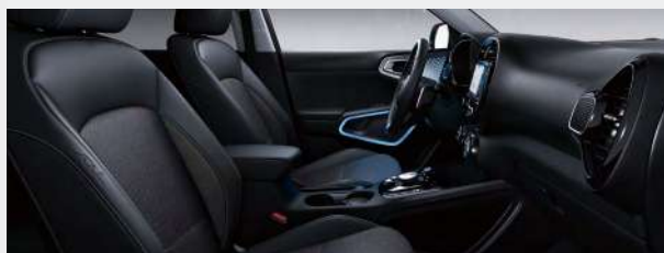
Sedili in tessuto e pelle artificiale