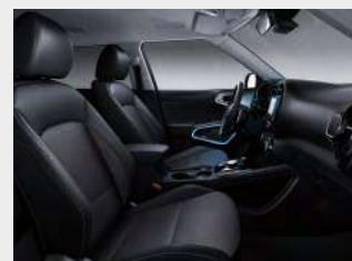
Sedili in tessuto e pelle artificiale