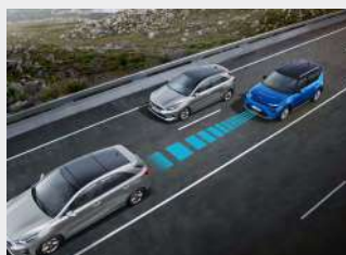
Smart Cruise Control (SCC)