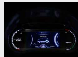
Supervision cluster da 7,0"