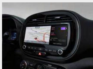
Kia Navigation System DAB con schermo touchscreen da 10,25", Apple Car Play/Android