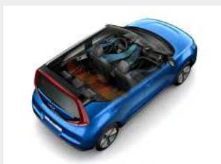
Pompa di calore