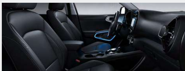
Sedili in pelle