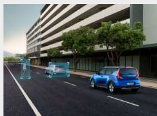
Forward Collision Avoidance assist (FCA) vetture, pedoni e ciclisti