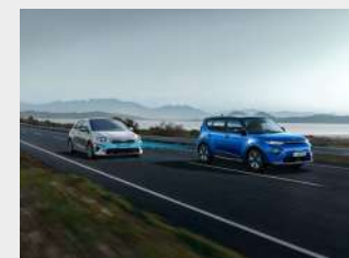
Blind-spot Collision Avoidance Assist (BCA)