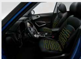
Sedili anteriori riscaldabili