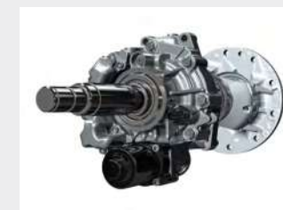
Differenziale a gestione elettronica dello slittamento