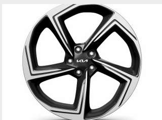
Cerchi in lega da 21"