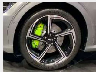
Dischi freno anteriori da 380mm con pinze colore Neon