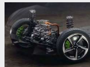
Sospensioni a controllo elettronico