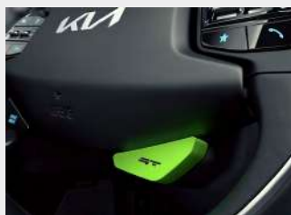
Drive Mode Select con modalità "GT"