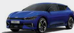
Yacht Blue (DU3)