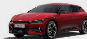
Runaway Red (CR5)