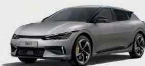
Moonscape Matte (KLM)