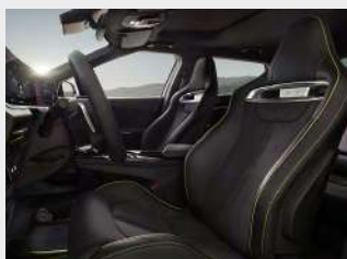
Sedili sportivi a guscio in tessuto scamosciato