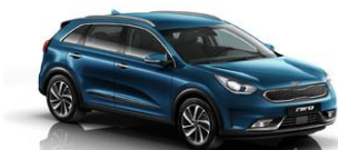
Cerulean Blue (C3U)