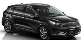
Black Soul (ABP)