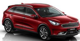
Temptation Red (K3R)