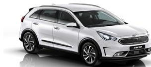
White Soul (UD)