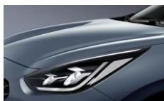
Horizon Blue (BBL)