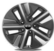
Cerchi in lega da 16" 205/60R16