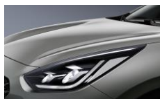
Steel Gray (KLG)