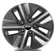
Cerchi in lega da 16" 205/60R16