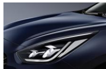
Gravity Blue (B4U)