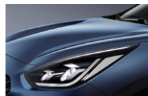
Cerulean Blue (C3U)