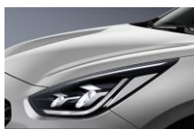
Silky Silver (4SS)