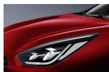
Runway Red (CR5)