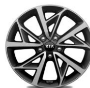
Cerchi in lega da 18" 225/45R18