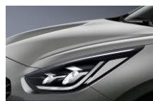
Steel Gray (KLG)