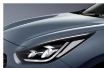
Horizon Blue (BBL)