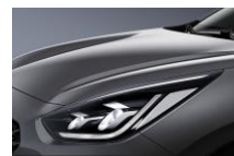
Platinum Graphite (ABT)