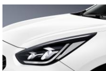
Clear White (UD)