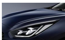
Gravity Blue (B4U)