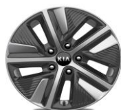
Cerchi in lega da 16" 205/60R16