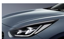
Horizon Blue (BBL)