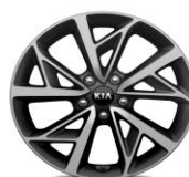
Cerchi in lega da 18" 225/45R18