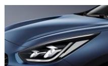
Cerulean Blue (C3U)