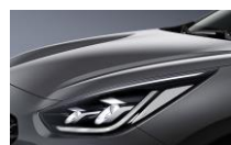
Platinum Graphite (ABT)