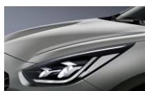
Steel Gray (KLG)